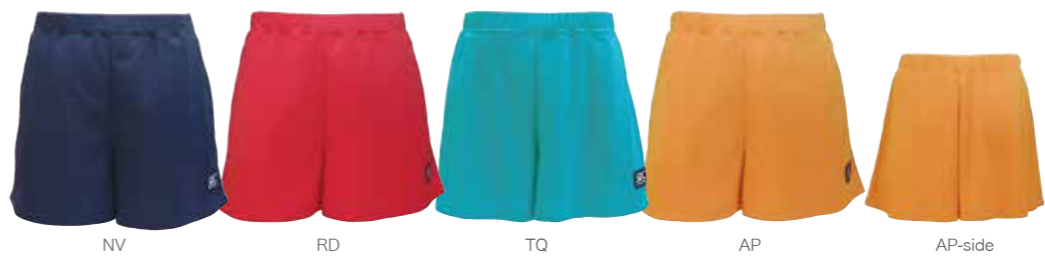
NV RD TQ AP AP-side