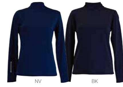
冬素材の暖かインナー