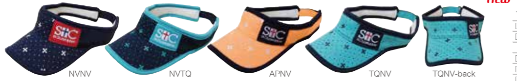
NVNV NVTQ APNV TQNV TQNV-back