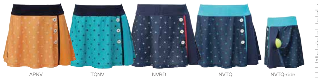
APNV TQNV NVRD NVTQ NVTQ-side