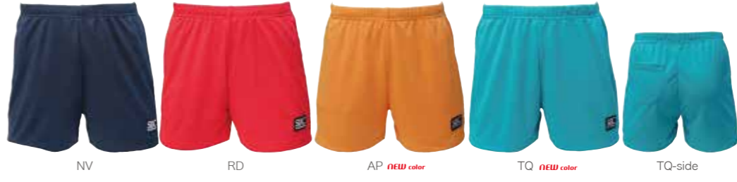
NV RD AP NEW color TQ NEW color TQ-side