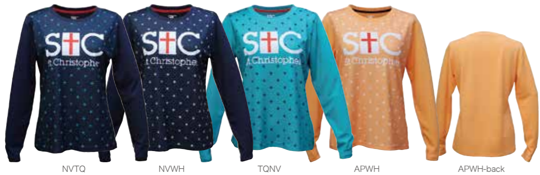
NVTQ NVWH TQNV APWH APWH-back