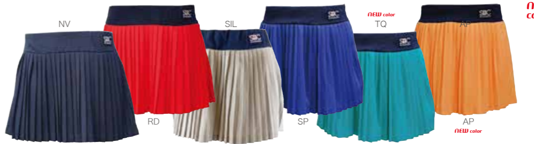
NV RD SIL SP TQ AP NEW color