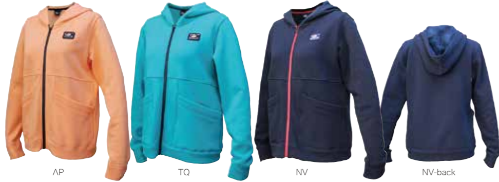
AP TQ NV NV-back