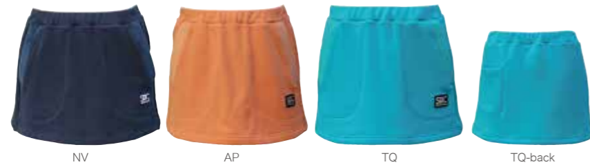
NV AP TQ TQ-back