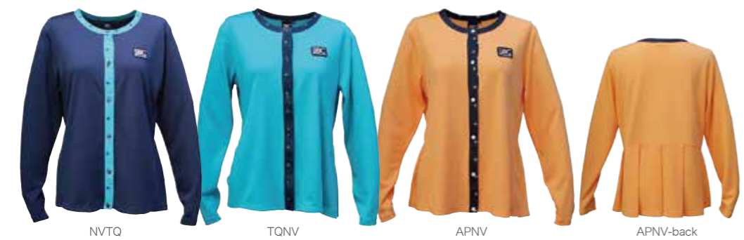
NVTQ TQNV APNV APNV-back