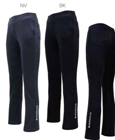
しっかり素材のちよいと裾広がり的美脚シルエット 両サイド&両おしりポケット付