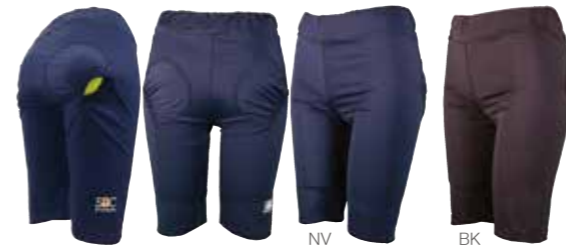
軽くて涼しい新素材の膝上丈レギンス おしり両側にボールポケット付