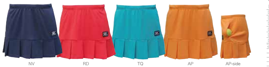
NV RD TQ AP AP-side