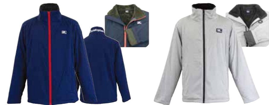
ウインド生地+ボア裏地のあったかジャケット