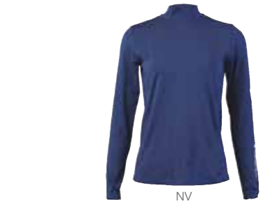
しっかり生地で脇切り替え縫製の、明るめネイビーカラーのロングスリーブインナー