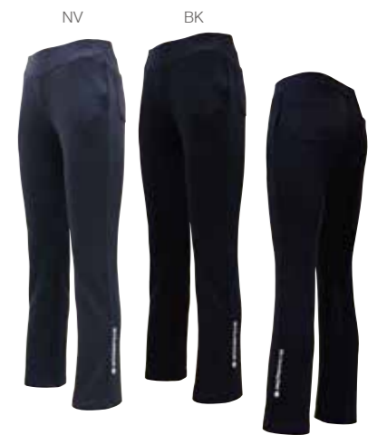
軽量素材の美しいシルエット 両サイド&両おしりポケット付