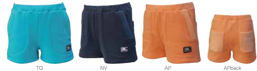
TQ NV AP APback