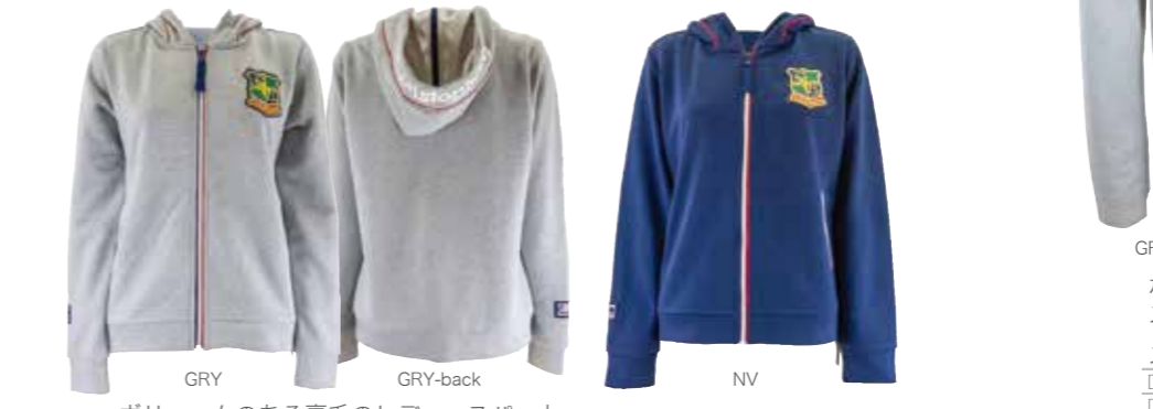
GRY GRY-back NV

ボリュームのある裏毛のレディースパーカー 胸のエンブレム刺繍ワッペンが効いています。