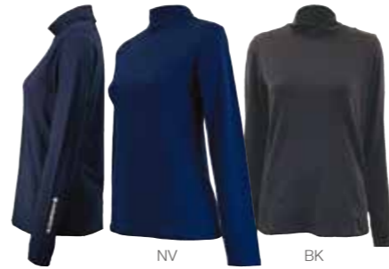
定番のシンプルな夏素材のインナー