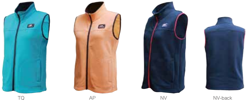
TQ AP NV NV-back