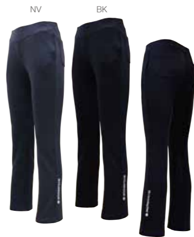
しっかり素材の美しいシルエット 両サイド&両おしりポケット付