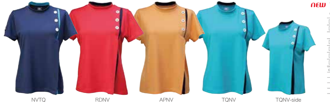
NVTQ RDNV APNV TQNV TQNV-side

□品番 STC-BBA4550 □カラー ネビ-/ネビ-、ネビ-/ターコイズ、アプリコット/ネビ-、ターコイズ/ネビ- □素材 ポリエステル 100% □価格 税込 ¥3,520 □サイズ フリー (55±3cm) □ベトナム製