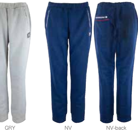
GRY NV NV-back